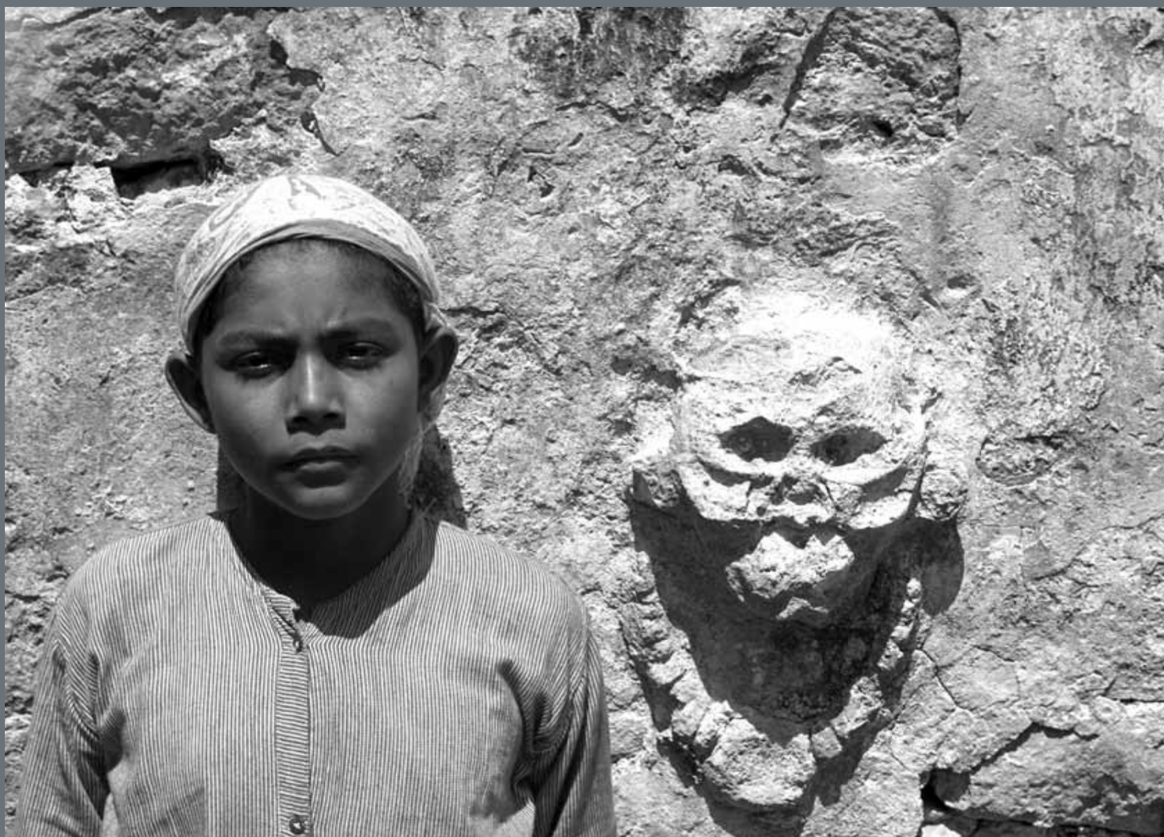
Niño maya de Tulum