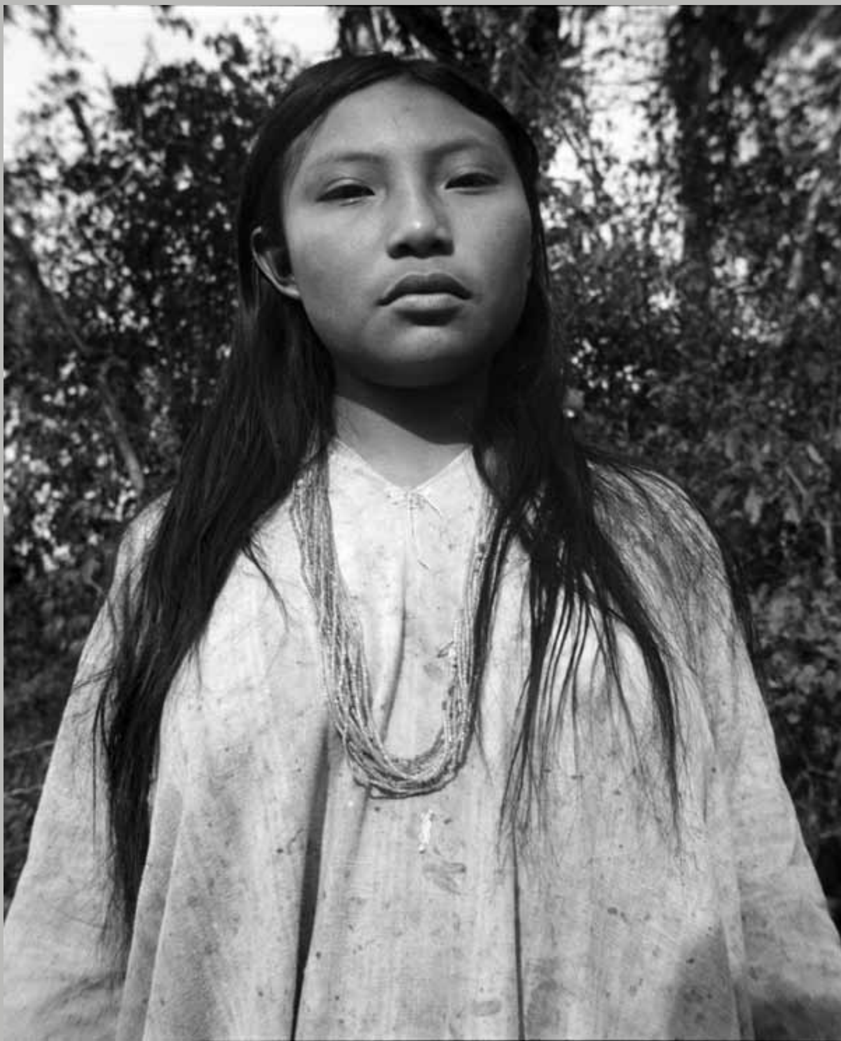
Margarita de Bonampak