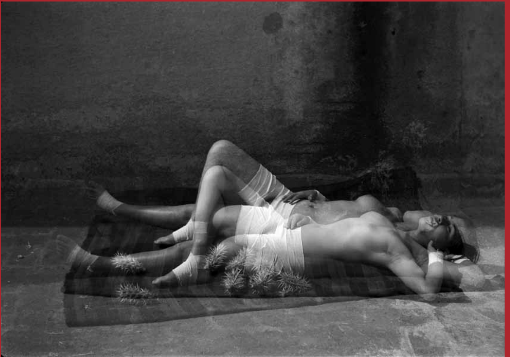
La buena fama 2