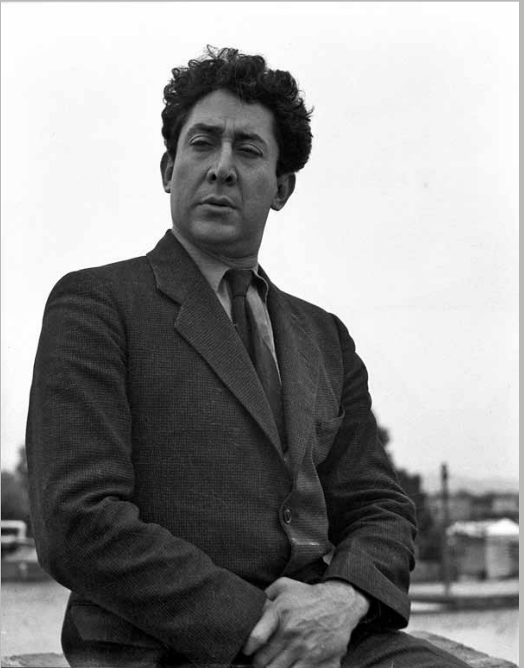
David Alfaro Siqueiros