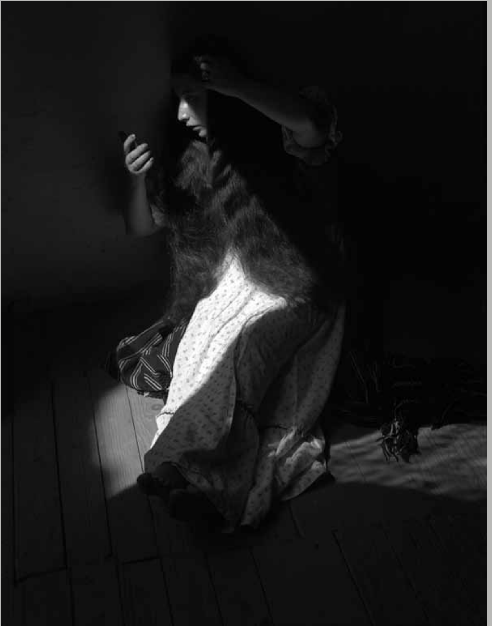
Retrato de lo eterno