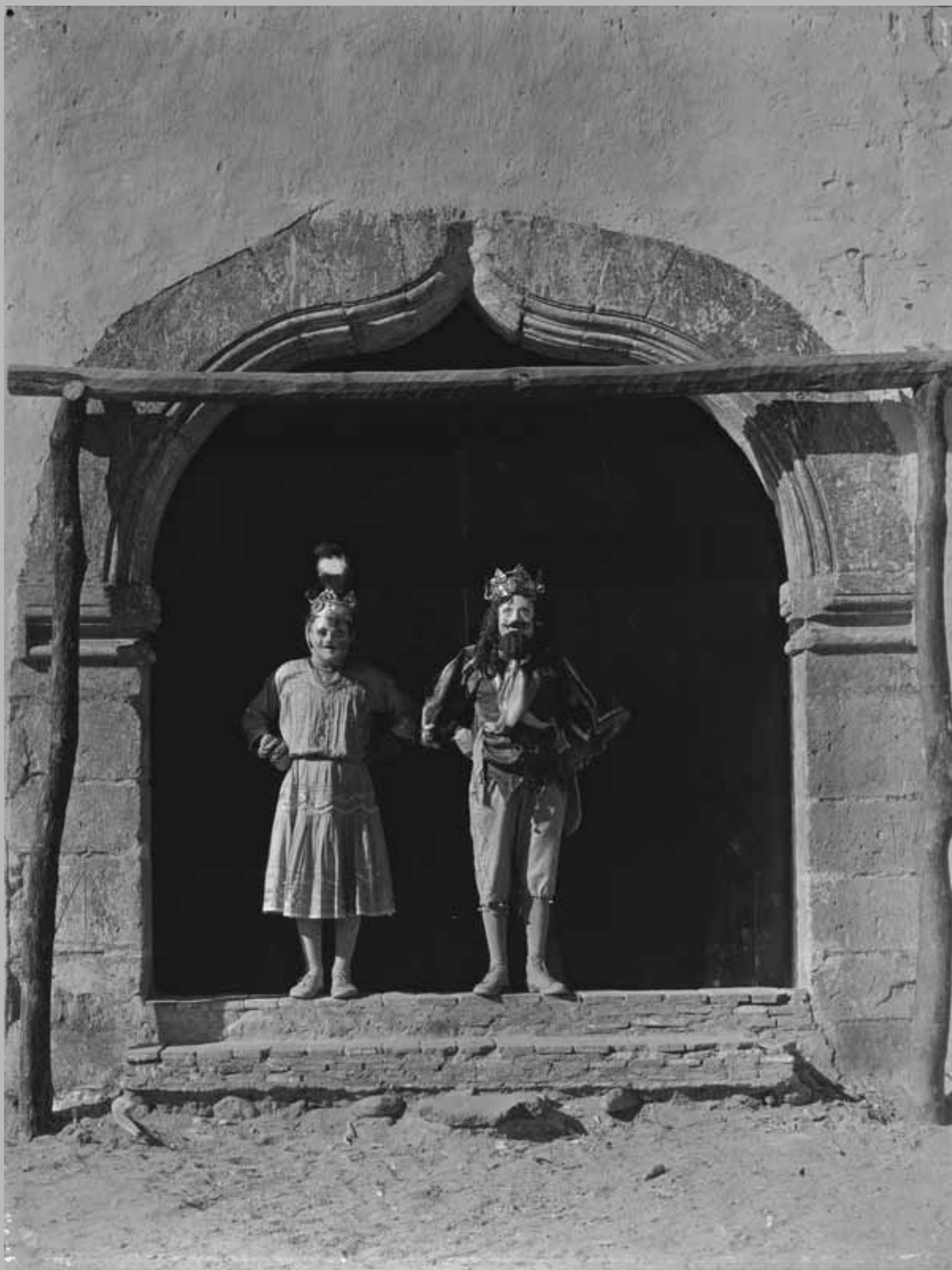
Reyes de danza