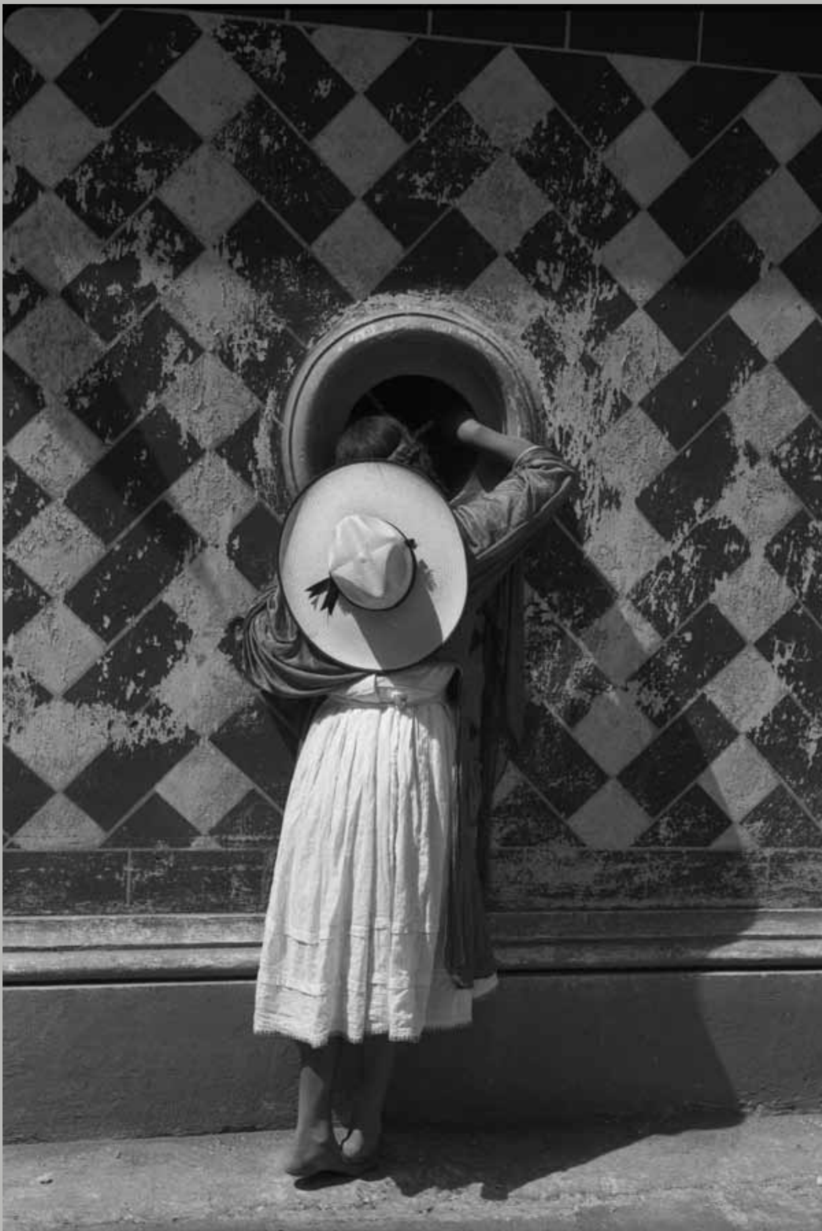
La hija de los danzantes