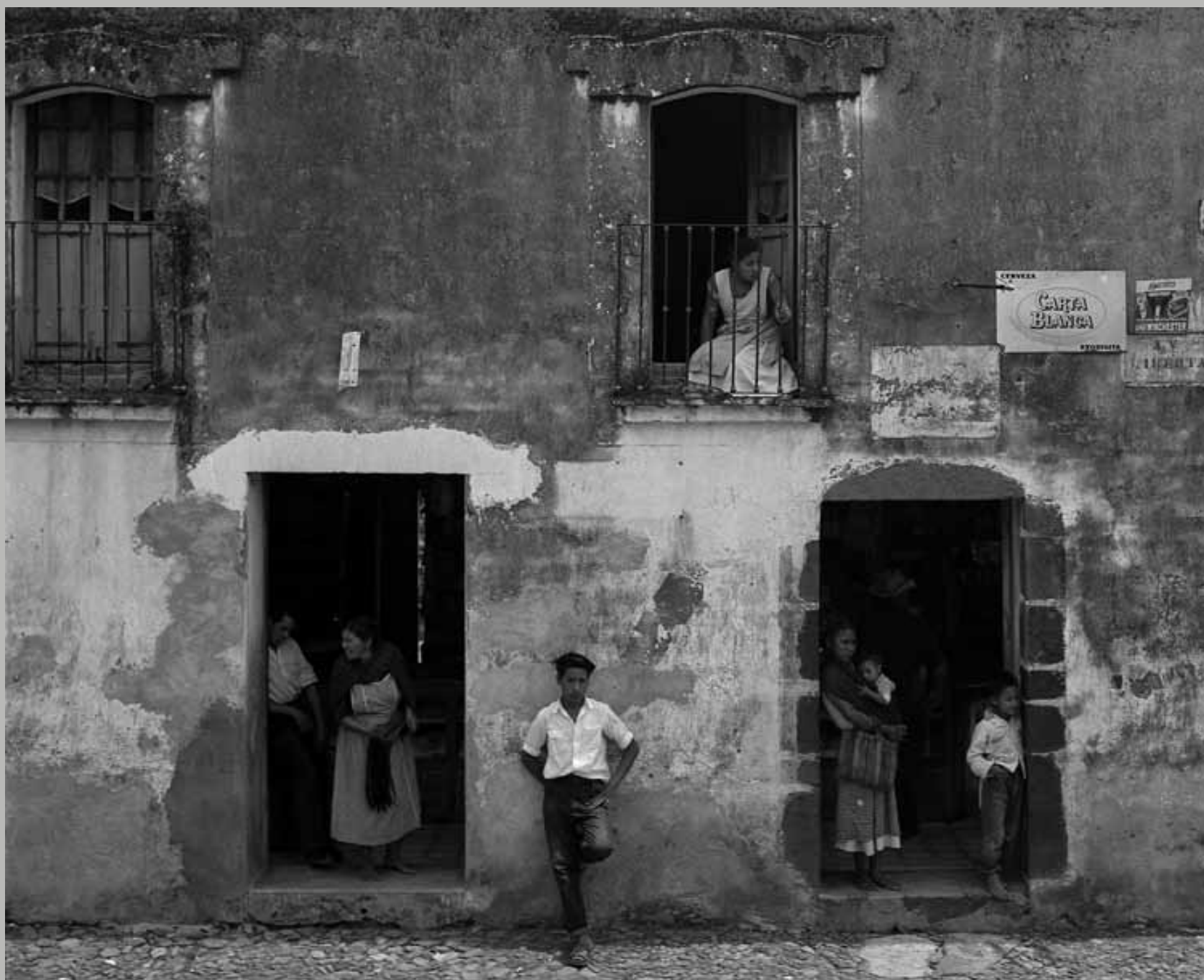
Retablo de Atlatlahucan